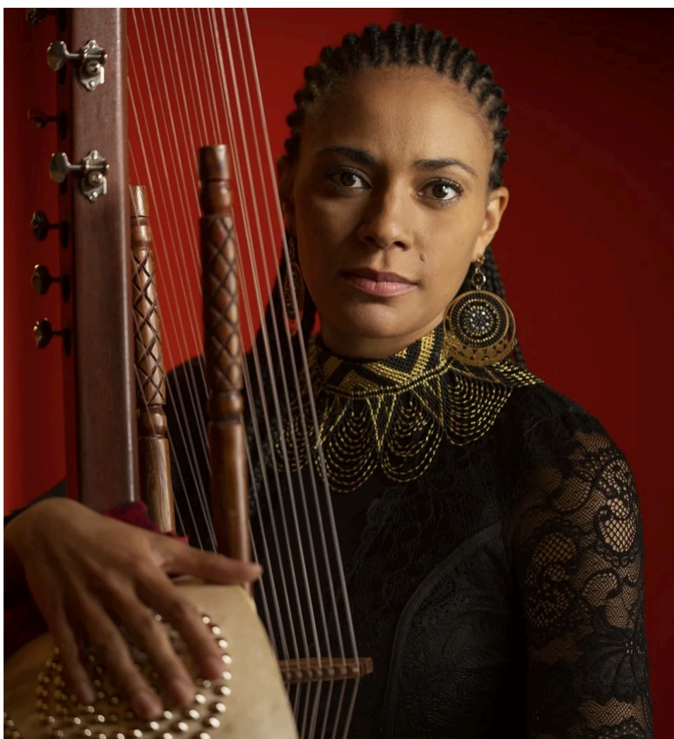
Sona Jobarteh.

Sona Jobarteh är en pionjär inom den gambiska musikscenen. För när det kommer till stränginstrumentet kora och den västafrikanska sångtraditionen griot har det alltid varit män som spelat. Tills Sona Jobarteh dök upp. Hennes mer välkände kusin Toumani Diabaté hann spela i Malmö två gånger innan han avled i somras. Nu tar Sona Jobarteh över.